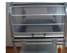
シャッター式安全ボックス

自動制御システムが備わった事で、 オペレータの安全性を考慮した設計・機能を提供します