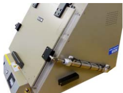
高耐久エアシリンダ

耐久性に優れたエアシリンダを採用しています。 1日に数回から数千回の開閉操作に耐える構造になっております。