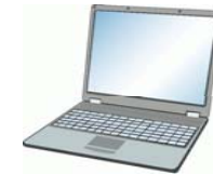
PCからのリモート操作